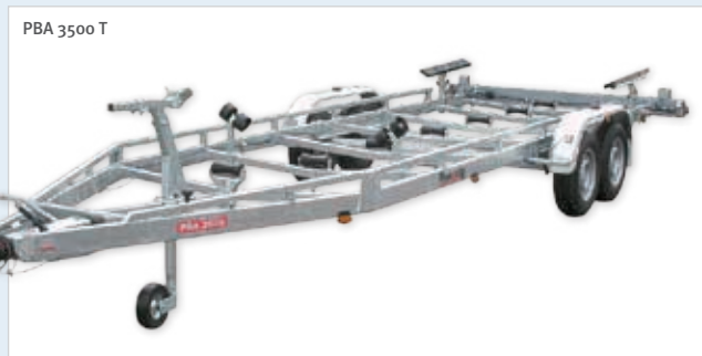
PBA 3500 T