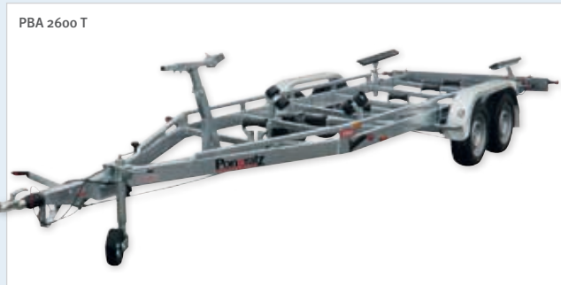
PBA 2600 T