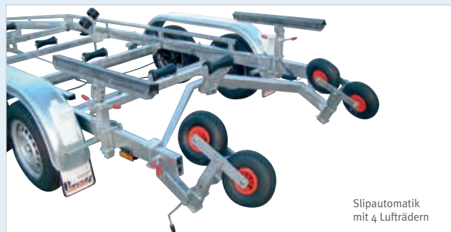
Slipautomatik mit 4 Lufträdern