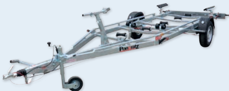
PBA 1800 G